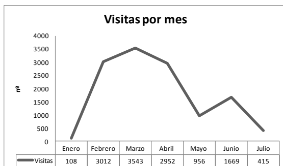
Fig. 2. Evolución del número de visitas del blog entre enero y julio

Este trabajo es un proyecto perteneciente a la V Convocatoria de Redes de Investigación en Innovación Docente , financiada por el Vicerrectorado de Coordinación, Calidad e Innovación de la UNED.